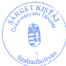
Polyák István Vilmos Társulási Tanács Elnöke