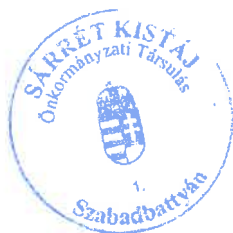
Polyák István Vilmos Társulási Tanács Elnöke